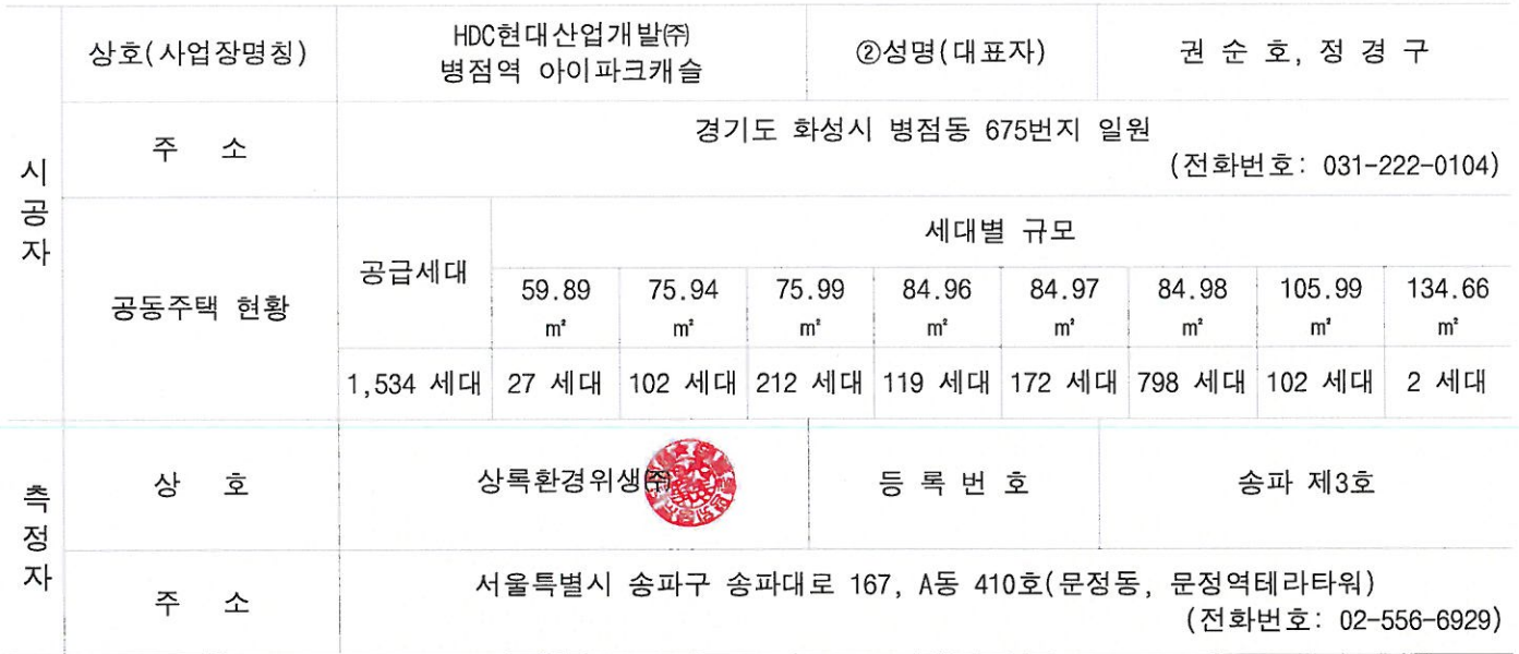
공동주택 공기질 측정결과(단위: \mu\text{g}/\text{m}^3 )